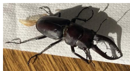
当施設を訪れたクワガタ

階下の「ぶどうの木保育園」に引き取られ、翌日には空に旅立っていきました。長く暑い夏の終わりを告げるようでした。