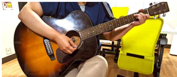
アコースティック・ギター。「あめんどうの花」の管理者も練習中!