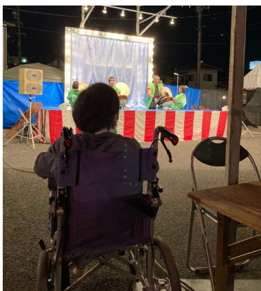
夏祭りに参加中の利用者様